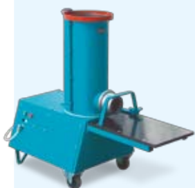
Mieszarka do gliny TS 20