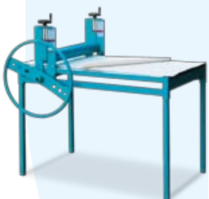
Walcarka PW 600