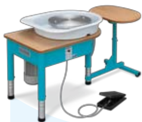
Koło garncarskie HMT 500