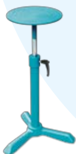
Drewniane tarcze garncarskie, toczki stołowe i stojakowe