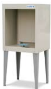
Kabina natryskowa SK 66 i odstojnik do gliny AB 100